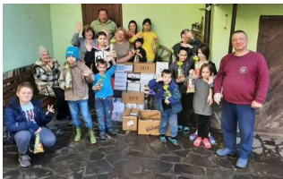
Waisenhaus bei Mukatschewo

Diese traumatisierten Flüchtlinge leben u.a. in Heimen, privat aufgenommen in Familien oder in Waisenhäusern u.a. rund um die größere Stadt Mukatschewo/Ukraine und sind dringend auf fremde Hilfe angewiesen. Es fehlt an allem: Lebensmittel, Hygieneartikel und medizinische Hilfsmittel.