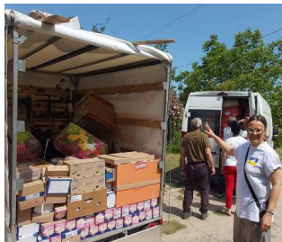
Flüchtlingsheim in Berezyinka