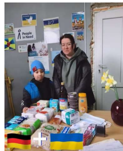
aus dem Flüchtlingsheim an bedürftige Familien.